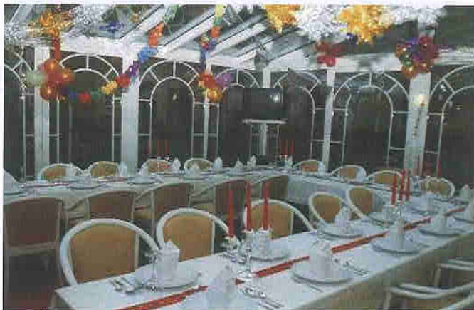
Neben dem Seminarraum steht auch der einladende Paradiesgarten zur Verfügung.