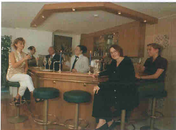
Bei besonderen Veranstaltungen ist unsere Bar geöffnet.